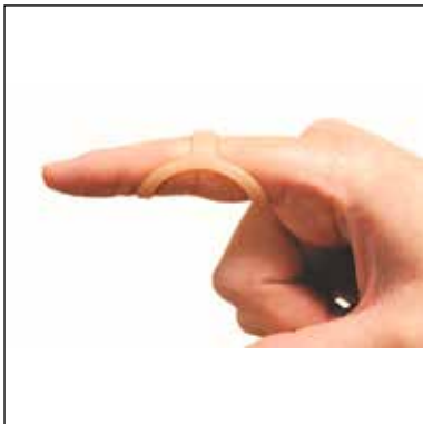
Mått: Omkrets fingerled