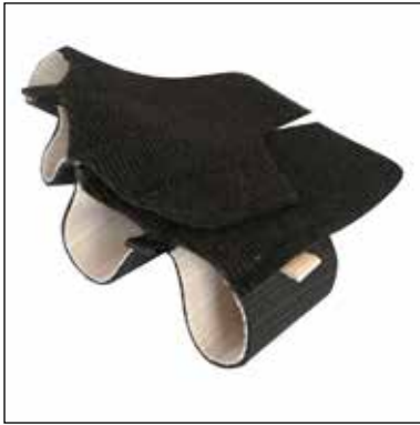
Mått: Omkrets MCP 2-5