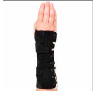
Mått: Omkrets handled