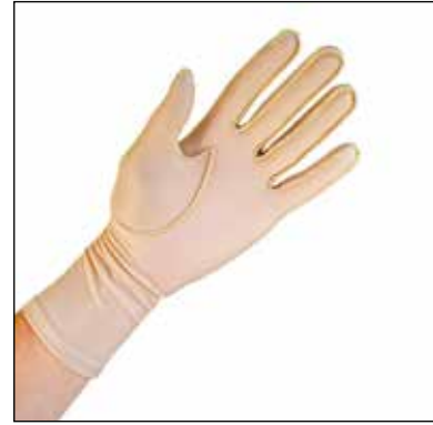
Mått: Omkrets MCP-Led.